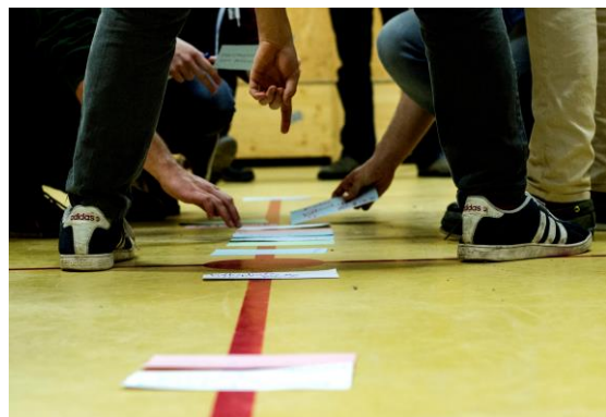
Aus- und Weiterbildung für Erwachsene und Multiplikator/innen