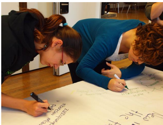
Entwicklung innovativer Angebote