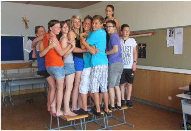
Übung Lebende Statue